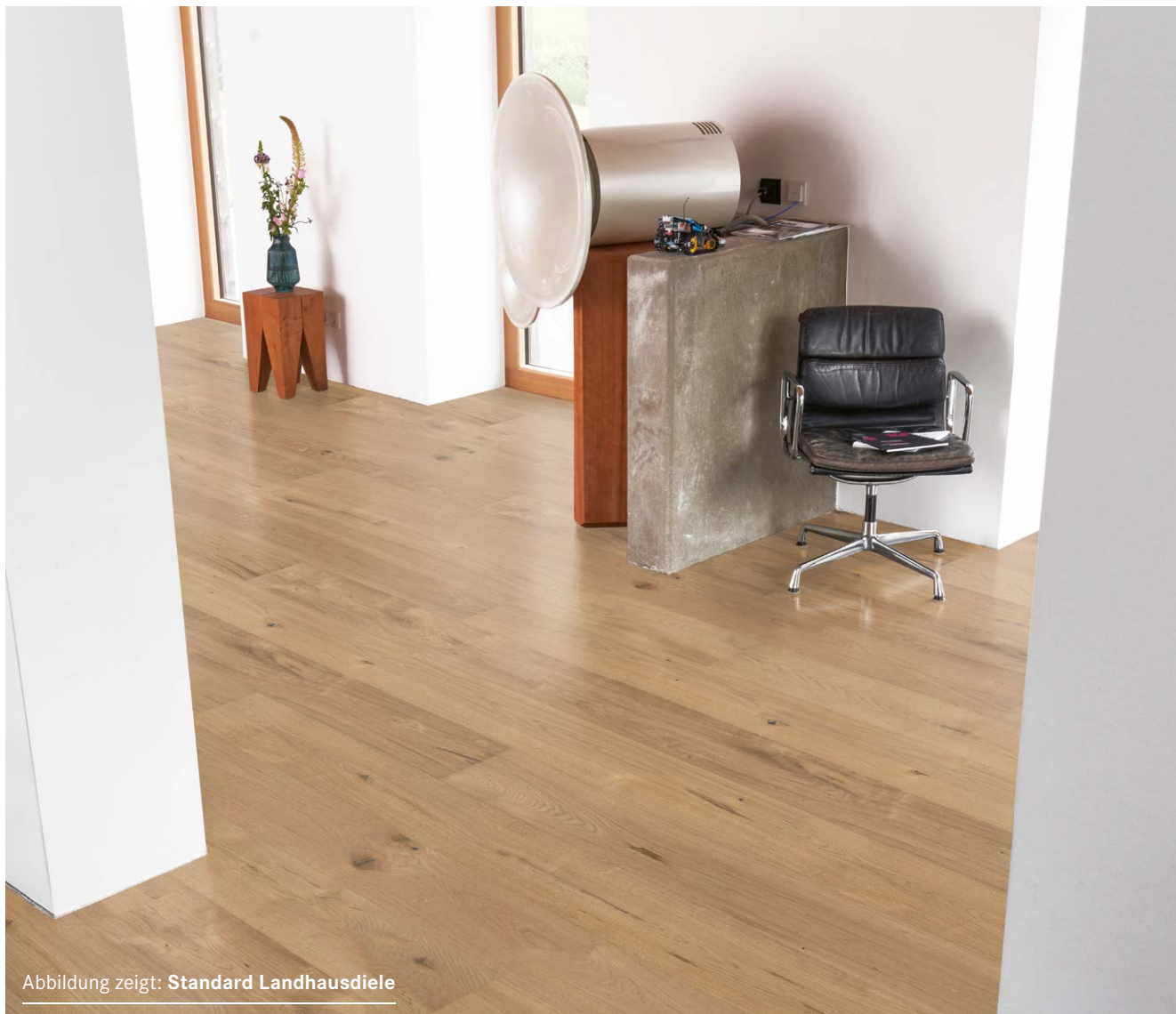
Abbildung zeigt: Standard Landhausdiele