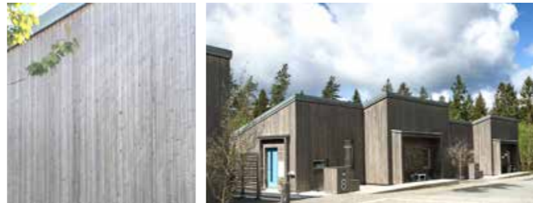
Linax Natur, das im Laufe der Zeit vergraut ist.

* Die vollständige Garantie finden Sie unter www.bitus.se