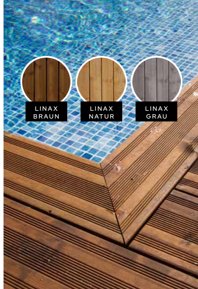
Linax Braun, profiliert

Neben den Linax-Produkten bieten wir in unserem Imprägnierwerk verschiedene traditionelle Holzschutzbehandlungen an, die unter anderem gemäß CTB, NTR und BS zertifiziert sind.