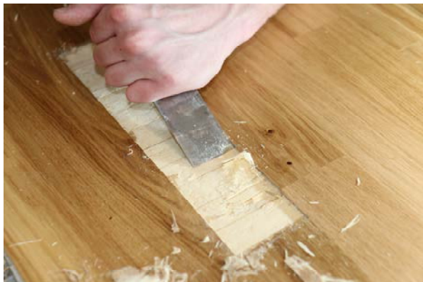
Leimschicht + 1 mm der Mittellage entfernen