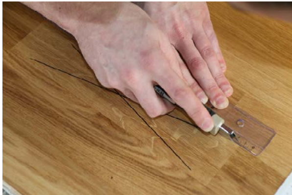
Lack mit dem Cuttermesser einritzen